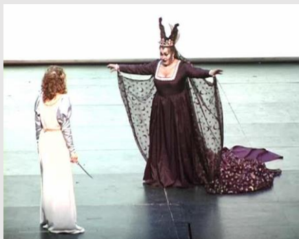
LA REINA DE LA NOCHE Der Hölle Rache La venganza del infierno

Las tres damas utilizando sus malas artes intentan hacerlos hablar. Con Papageno lo tienen fácil pero al príncipe no consiguen sacarle ni una sola palabra. En otra parte del bosque Pamina duerme extenuada por el cansancio soñando con su príncipe, cuando la malvada Reina de la noche surge de la oscuridad y le ordena que mate al mago Sarastro, su más odiado rival. Para ello le entrega un puñal y desaparece.