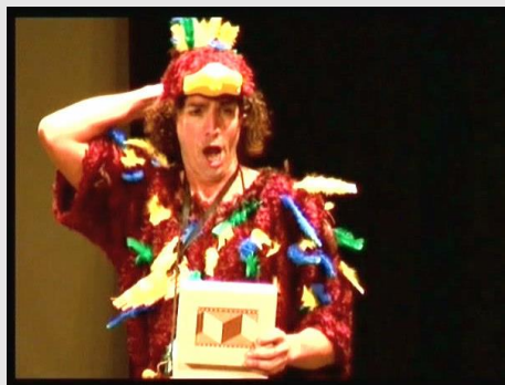
PAPAGENO Ein Mäfchen oder Weibchen Una muchacha o una mujercita

En ese instante vuelve a aparecer la vieja que le pide fidelidad para toda la eternidad, sino quedará encarcelado y deberá renunciar al mundo para siempre. El pajarero acepta a regañadientes y en ese momento la vieja se transforma en una guapa y joven muchacha vestida igual que él y desaparece.